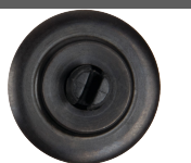
Molette pour coupe-tubes