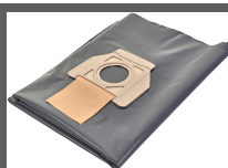
Sacs gravats jetables 30 l